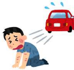
車にはねられて死亡