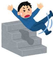
階段から落ちて死亡