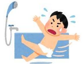
風呂場で転倒し死亡