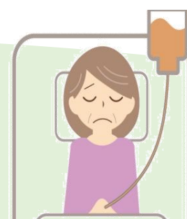
交通事故で所定の要介護状態になった