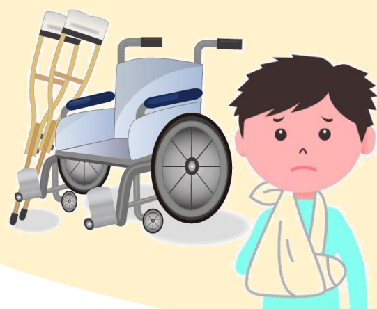
車椅子を押していて転倒