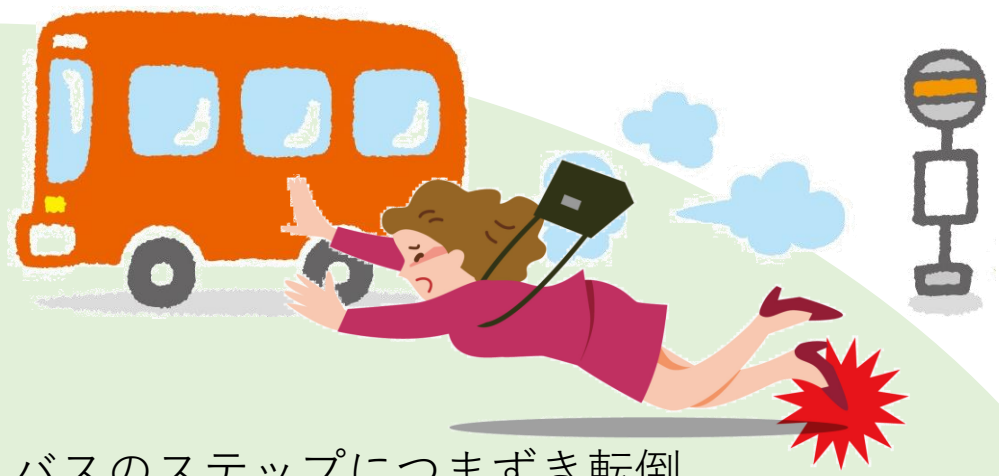
バスのステップにつまずき転倒