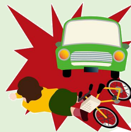
ひき逃げに遭い死亡