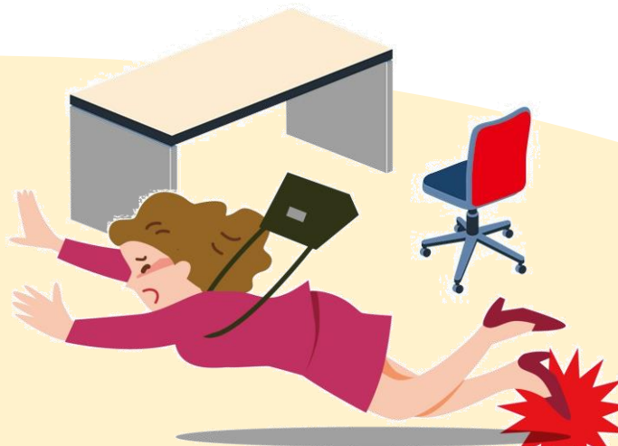
院内でつまずいてケガ