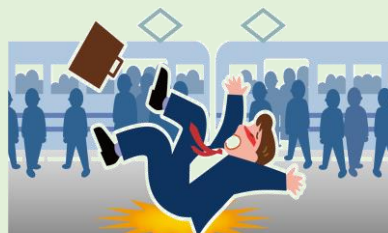
駅構内で転倒してケガ