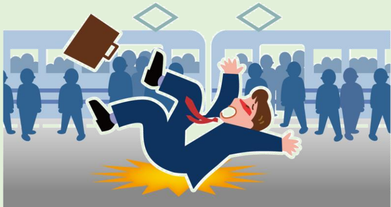
駅構内で転倒してケガ