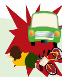
ひき逃げに遭い死亡