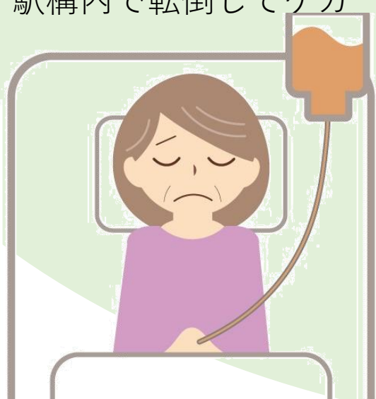
交通事故で所定の要介護状態になった