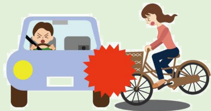
自転車に乗っていてケガ