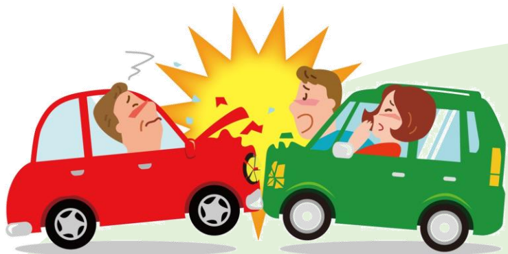
車同士で衝突してケガ