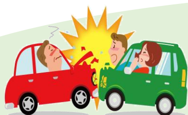
車同士で衝突してケガ