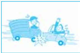
車で衝突して死亡