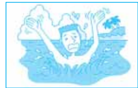
海でおぼれて死亡