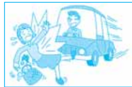
車にはねられて死亡